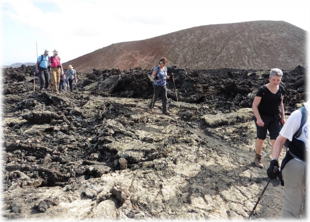
Eerst is er een aanlooproute over lavavelden en over sintelpaden, naar de voet van de krater.