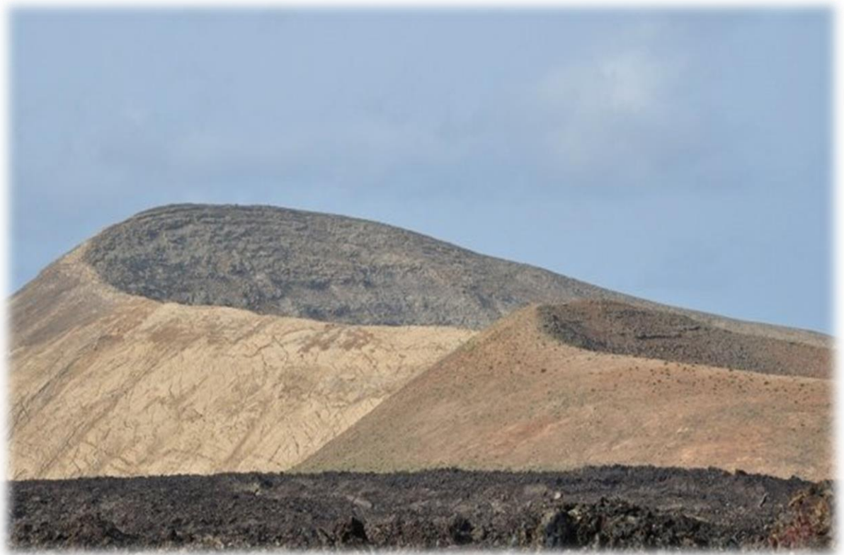
Op de foto hierboven zien we de Montaña Calderata met daarachter zijn grote broer Caldera Blanca.