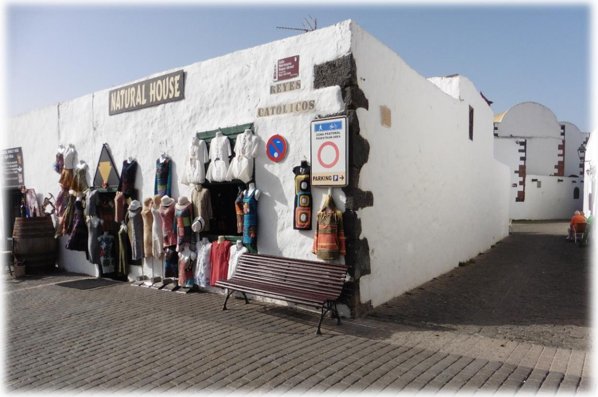
Na onze wandeling brengen we een bezoekje aan Teguise, de vroegere hoofdstad van Lanzarote.